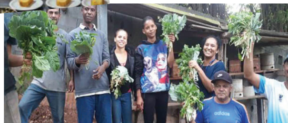
PPAT - POT Redenção II - Dados novembro/2022